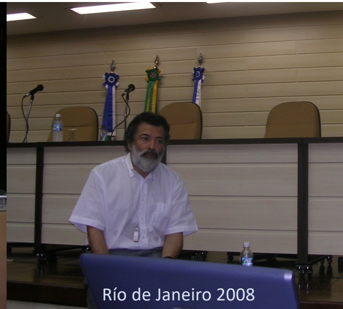
Río de Janeiro 2008