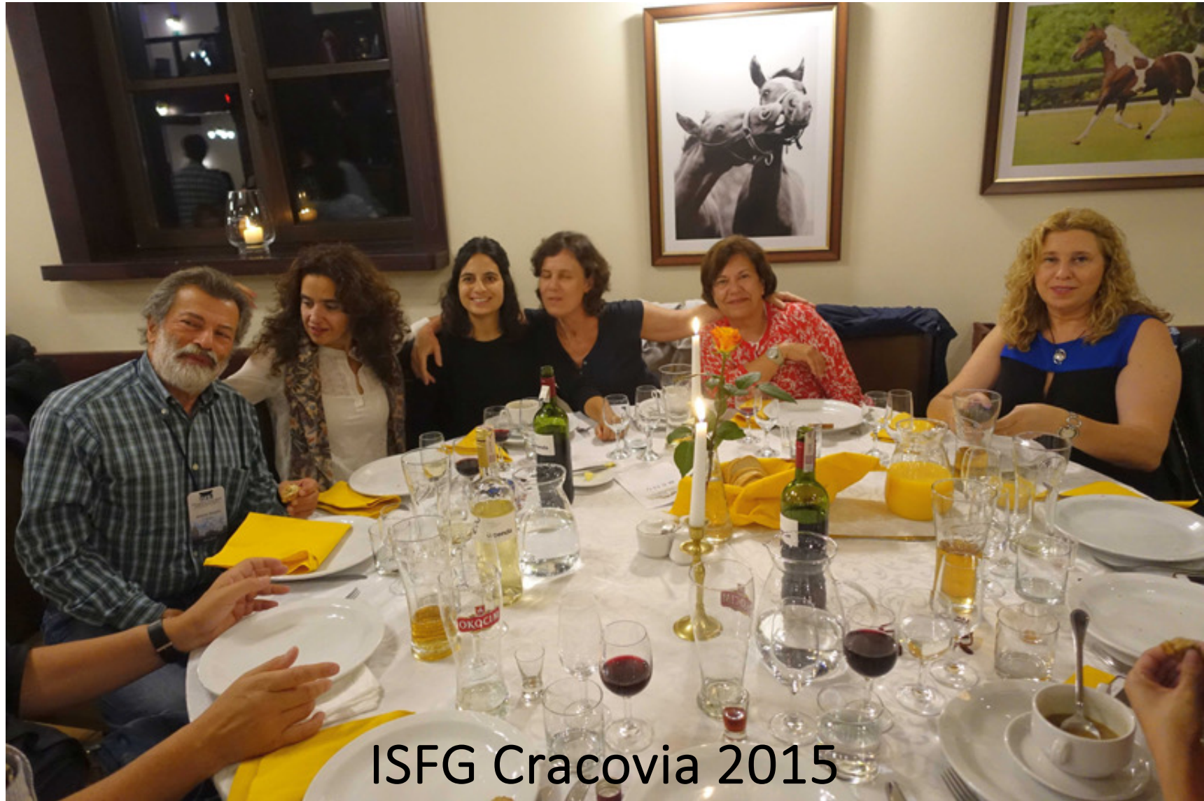
ISFG Cracovia 2015