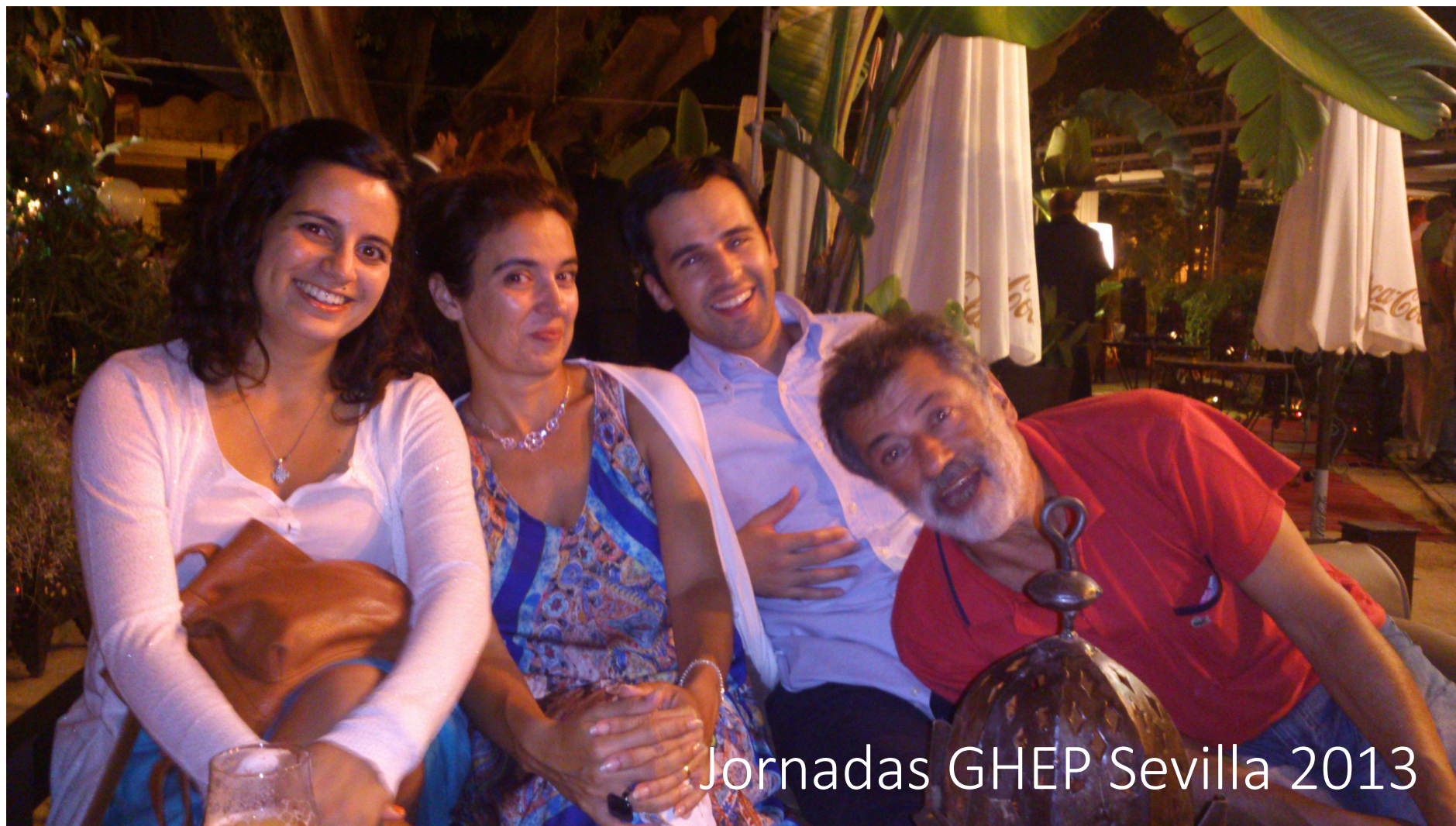
Jornadas GHEP Sevilla 2013