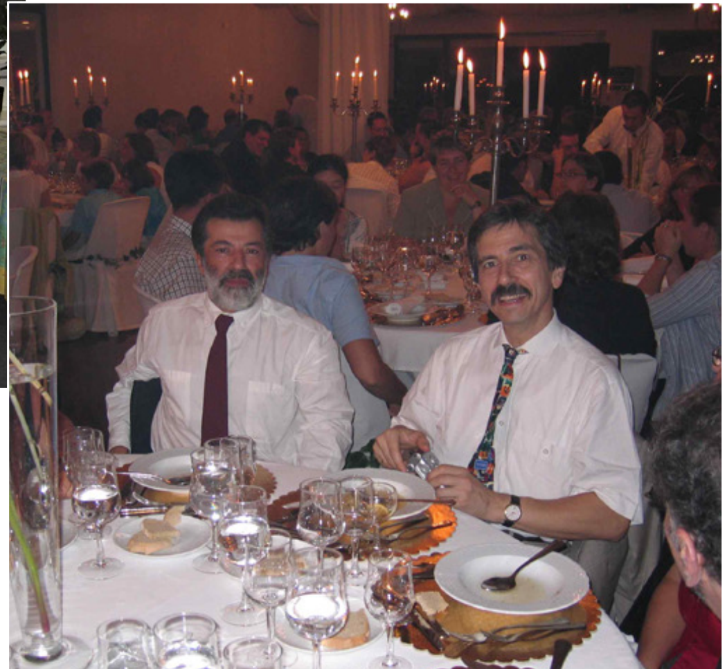
ISFG Açores 2005