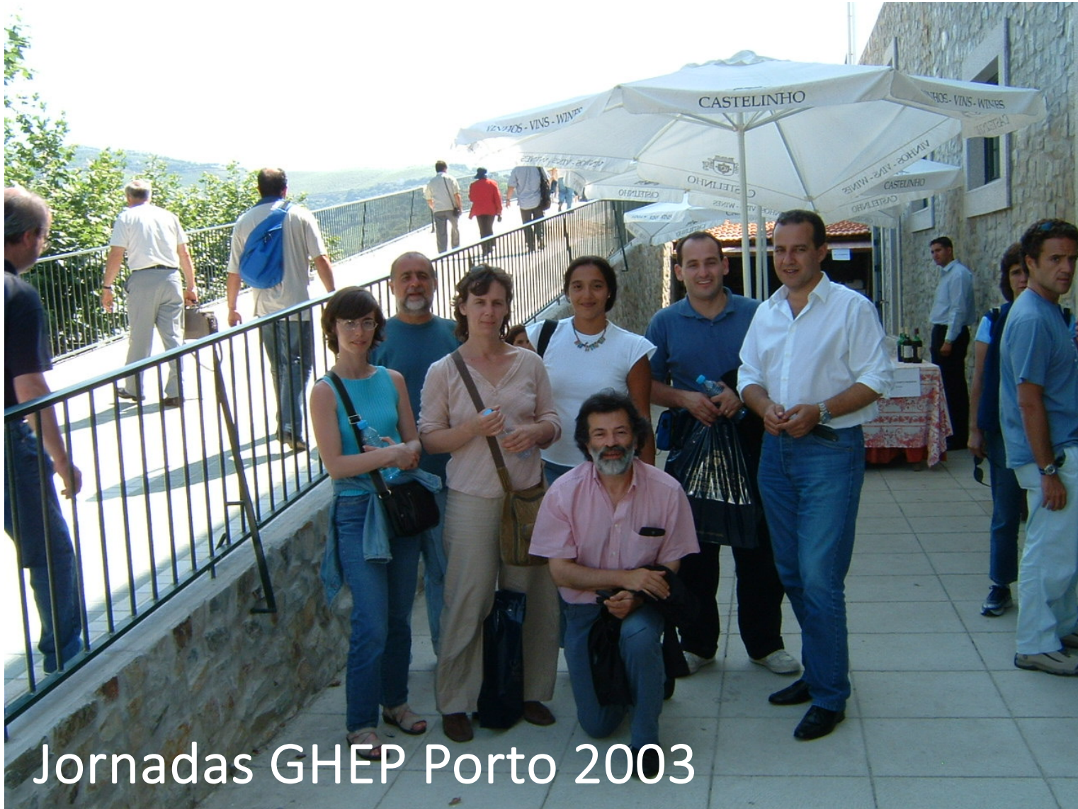
Jornadas GHEP Porto 2003