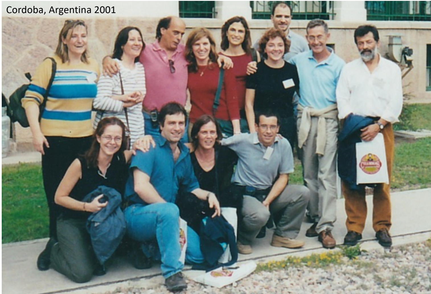
Cordoba, Argentina 2001

Hace ya mucho desde mis primeros encuentros con António.