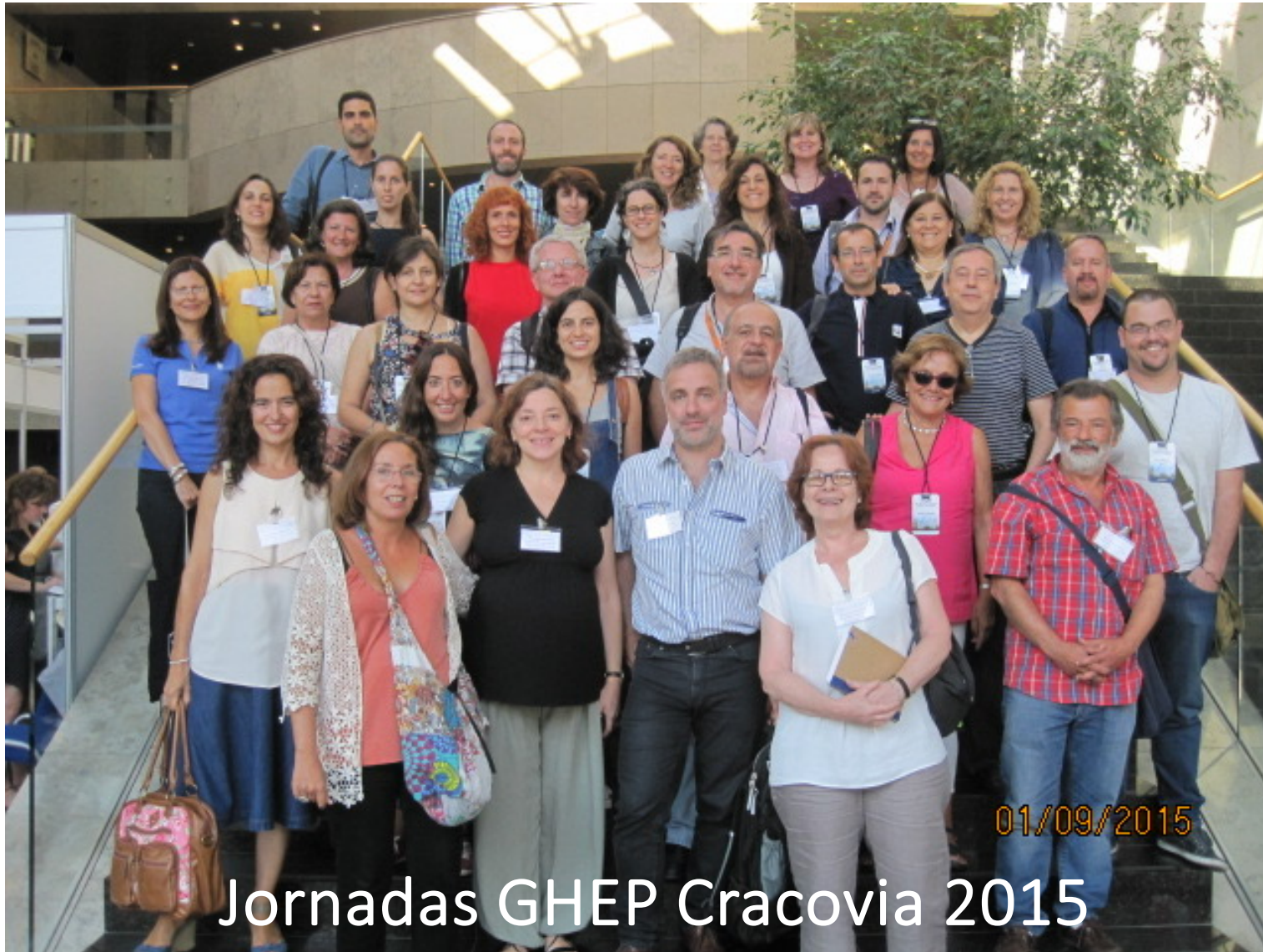
Jornadas GHEP Cracovia 2015